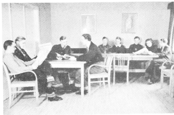
Kostskolens læsestue omkring 1942