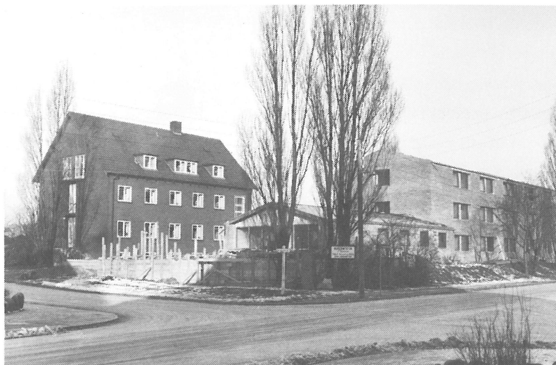
Den nye kostskolebygning og den ene lærebolig under opførelse. Hjørnet Skolebakken-Frisengårdsvej, 1958.

Allerede i 1950 var der blevet afholdt en arkitektkonkurrence om en ny gymnasiebygning i forbindelse med kostskolen på Skolebakken. Denne konkurrence blev i marts 1950 vundet af den unge og dengang temmelig ukendte Odense-arkitekt Jørgen Stærmosen. Der kom til at gå 7 år, indet byggeriet blev sat igang.