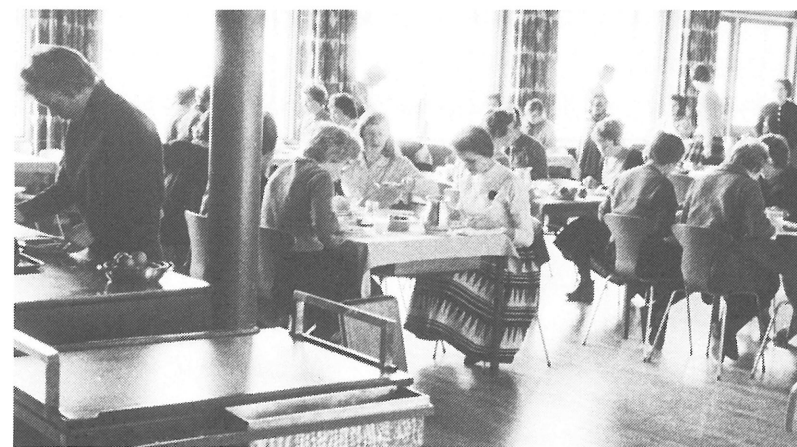
Spisesalen i den nye kostskolebygning omkring 1960

Til slut vil jeg fortælle, at jeg stadigvæk nu i 1990 bor i Nyborg, idet jeg blev gift med en nyborgenser. Hver eneste dag kører jeg forbi kostskolen og kan følge lidt med i, hvad der sker. Det ser ikke ud, som om det er helt det samme, som sidst i halvtredserne.