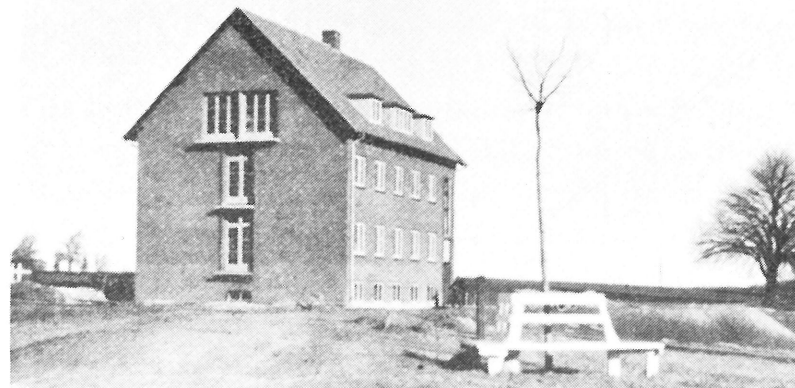
Kostskolebygningen i 1940